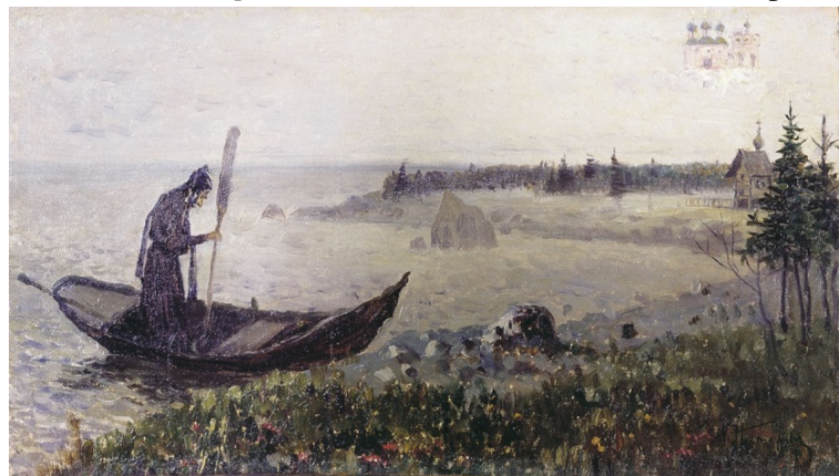
«Святой Зосима Соловецкий», художник М.В. Нестеров

Когда на острове собралось несколько отшельников, преподобный Зосима устроил для них небольшую деревянную церковь в честь Преображения Господня. По просьбе преподобного Зосимы из Новгорода был прислан в новосозданную обитель игумен с антиминсом для